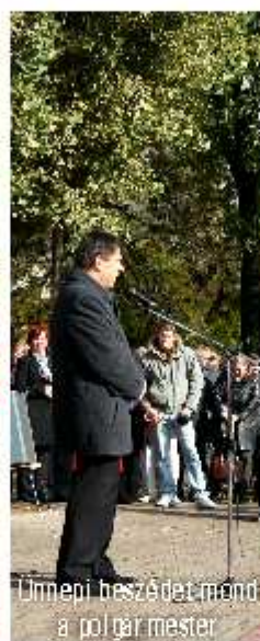
Ünnemi beszédet mond a polgármester