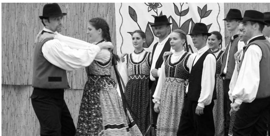
A felnőtt csoport a júniusi Pannónia Néptánc Fesztiválon

A jubileumi gálaműsor december 2-án lesz Gödöllőn