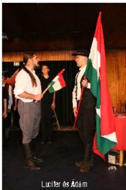
Lucifer és Ádám

A kimaradt szín – 56-os emlékműsor (5-ik oldal)